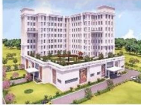
पटना विश्व विद्यालय प्रशासनिक भवन